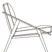
PNA 75 / 30"